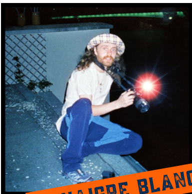
VINAIGRE BLANC @VINAIGRE.BLANC