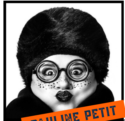
PAULINE PETIT @PAULINEPETITPHOTOGRAPHIE